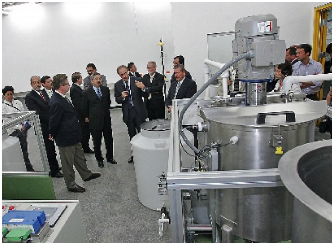
► Con una inversión de unos 70 millones de pesos, ayer arrancó operaciones la primera incubadora especializada en nanotecnología en el PIIT.

Sin embargo, no existe límite en la exención cuando el dueño demuestre haber habitado en la vivienda durante los 5 años previos a su venta.